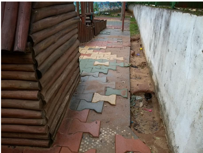
Lateral do Parque com buracos que as crianças podem cair, comprometendo a saúde e bem estar dos alunos, registro em 05/09/2019.