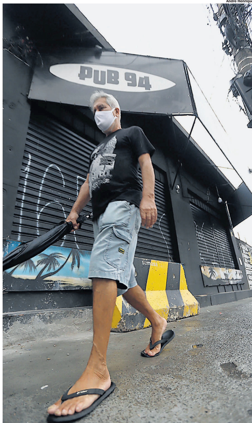
EM SANTO ANDRÉ. Casa noturna da Rua Carijós foi lacrada pela Prefeitura

MEMÓRIA: Ele colocou a região nas ondas do rádio Setecidades 2