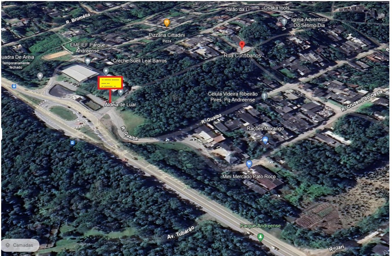
Foto anexa II: Sugestão para a colocação da Placa de identificação do Loteamento