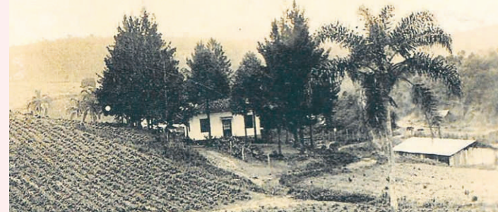
LAR. Sítio Casa Branca, local onde o casal morava e detinha plantações