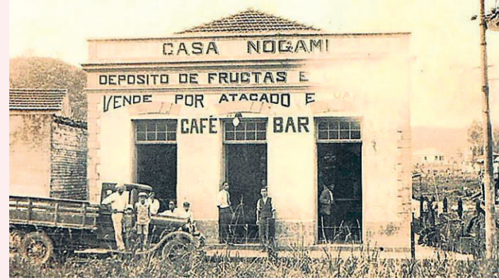
TRABALHO. Antiga loja da família, na região central de Ribeirão Pires