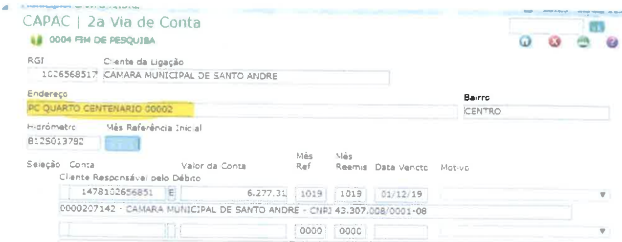
Imagem 3 – Sistema comercial/ protocolo de troca de hidrometro