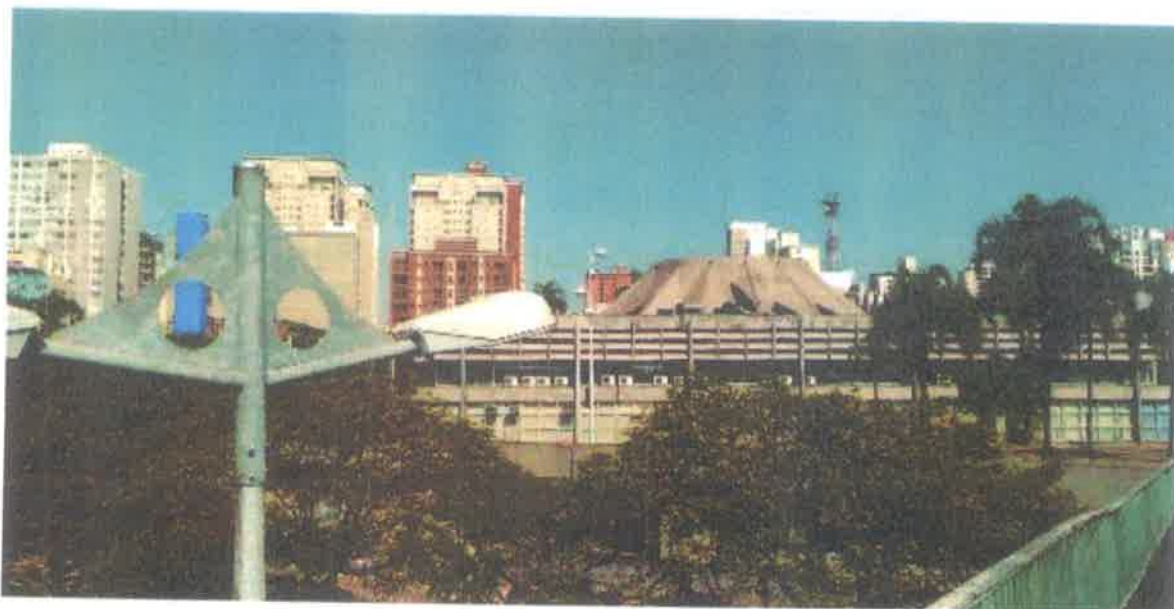
Imagem 1