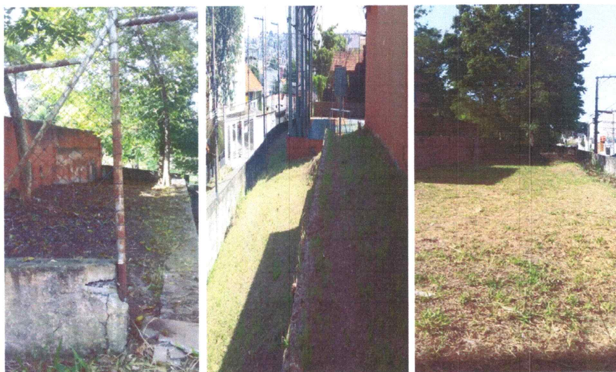
Fotos do serviço executado em 06/03/2024

Rua Arizona, nº 113. Parque Oratório – Santo André - SP CEP: 09250-450 Telefone: 4472-5242