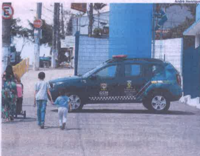
TRANSTORNO. Creche Francisca Zuk atendeu parcialmente os alunos

Na Emeief Jardim Irene, que atende 469 alunos, houve furto de menos de um metro de fiação – as aulas também foram mantidas. Já na creche Francisca Zuk, que atende 374 alunos, os patrimônios não foram furtados. Algumas salas estavam abertas, a porta da secretaria estava com sinais de arrombamento e a porta da diretoria, fechada, porém, com o vidro quebrado. No período da manhã houve