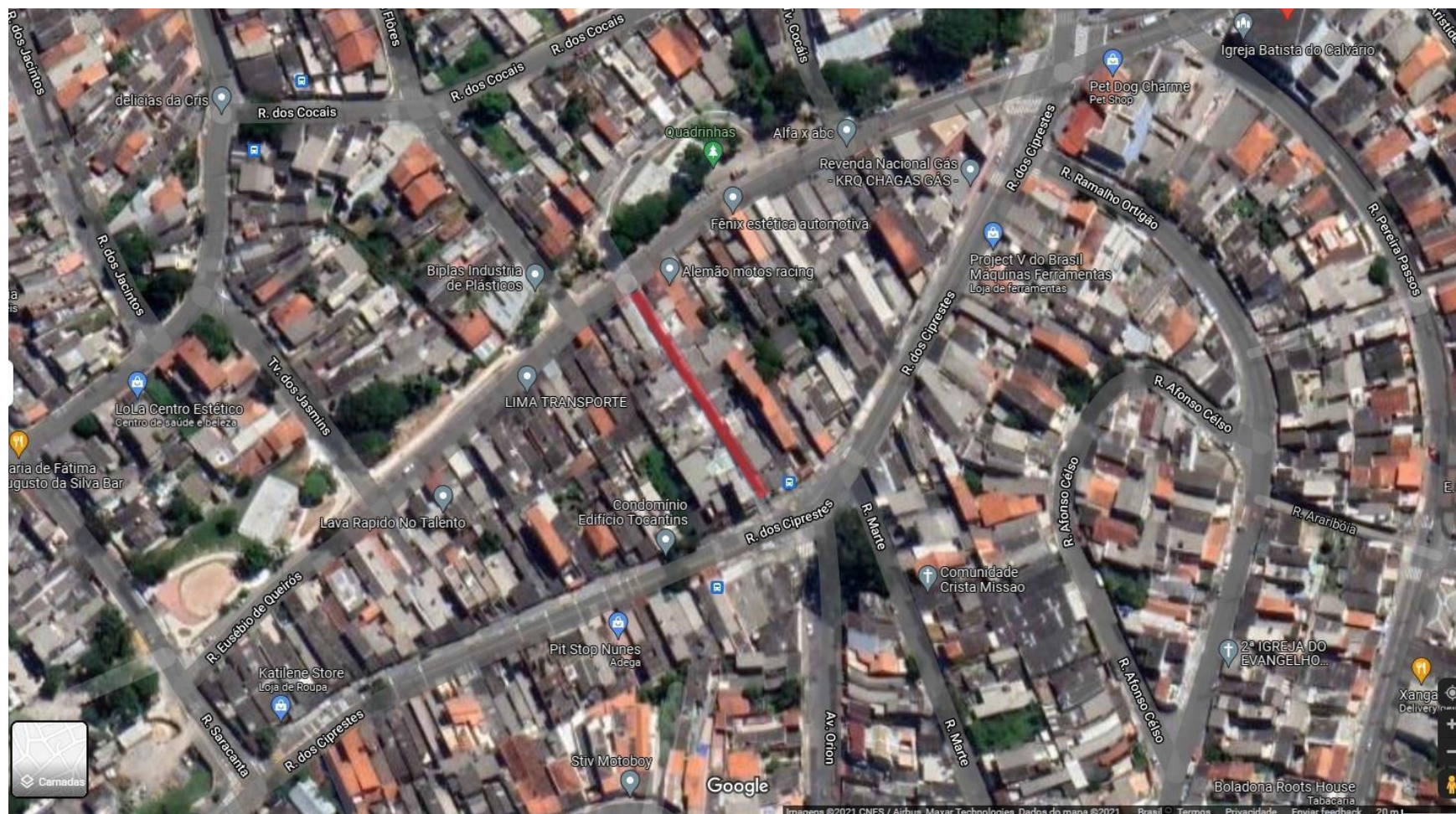
Foto aérea da viela.