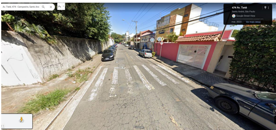
Foto 2: Necessita-se reforço de pintura de sinalização de solo, principalmente por ser área escolar.