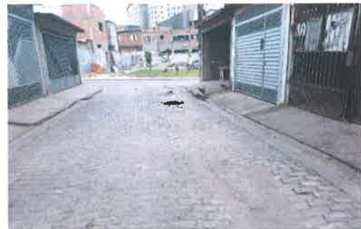
Rua Cinco Estrelas

Sala das Sessões, em 17 de outubro de 2019.