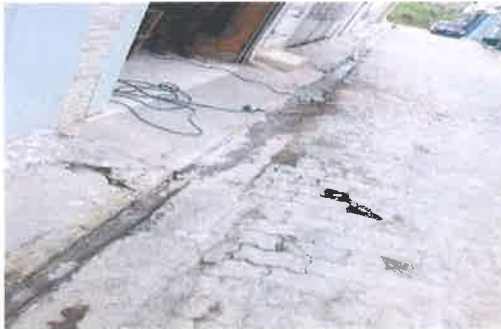
Rua Bela Flor

Os referidos buracos estão causando transtornos e prejuízos aos moradores e motoristas que realizam o trajeto.