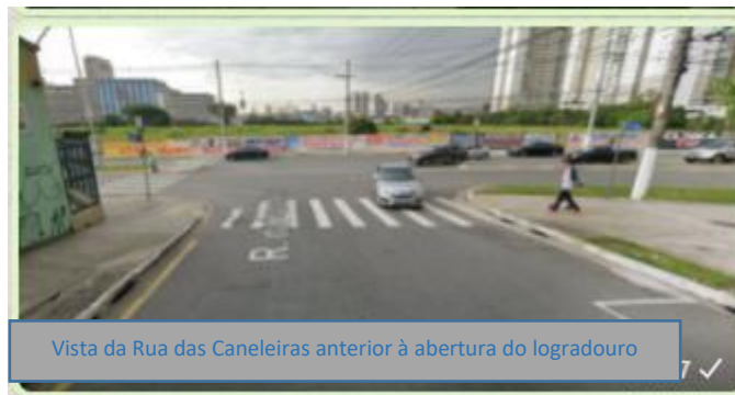
Vista da Rua das Caneleiras anterior à abertura do logradouro