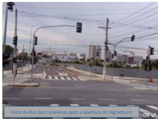
Vista da Rua das Caneleiras após a abertura do logradouro