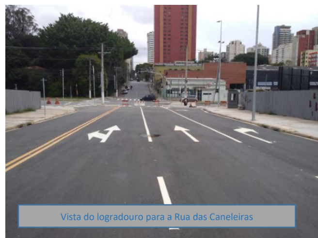
Vista do logradouro para a Rua das Caneleiras