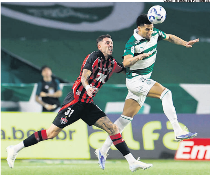
TUDO IGUAL. Baianos e paulistas ficaram no 0 a 0 no Allianz Parque

Tivessem tido mais qualidade os atacantes, teria ido ao intervalo em vantagem. Abel Ferreira lançou mão de Vitor Roque e Felipe Anderson no intervalo. O Palmeiras registrou melhora e indicou que intensificaria a pressão. Veiga perdeu gol em rebote.