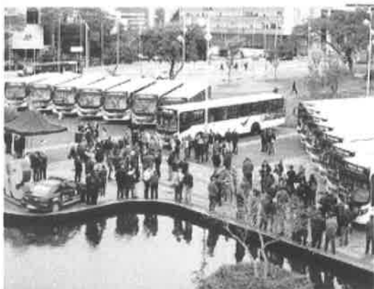
ROTA: Viajantes aguardam em São João do Rio em espera de ônibus da Rota 15.