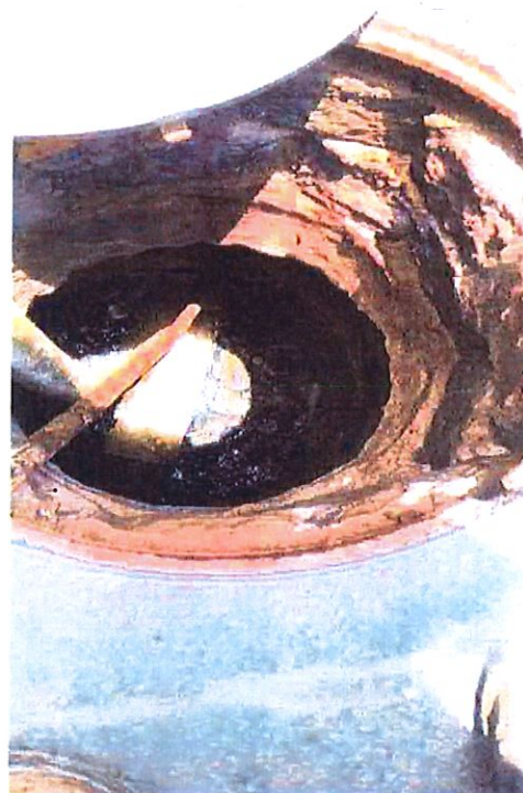
Imagem: Execução dos serviços solicitados

Por fim, ressaltamos o compromisso da SABESP com a qualidade dos serviços prestados, buscando sempre a melhoria dos serviços com foco nos clientes, atuando com flexibilidade para adaptar as condições adversas, mantendo o padrão de atendimento e qualidade.