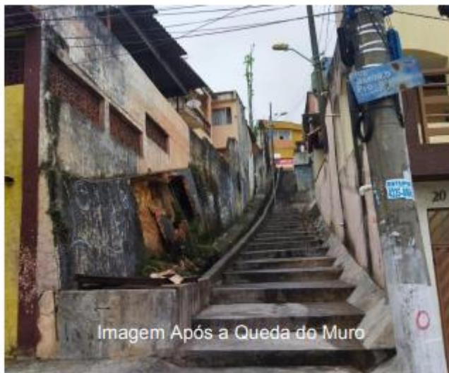
Imagem Após a Queda do Muro