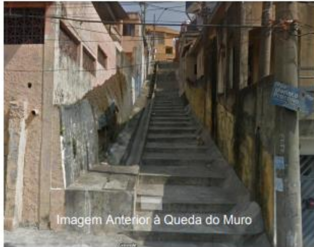
Imagem Anterior à Queda do Muro