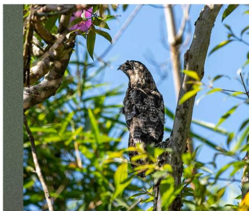
Urutau registrado durante visita da reportagem à região